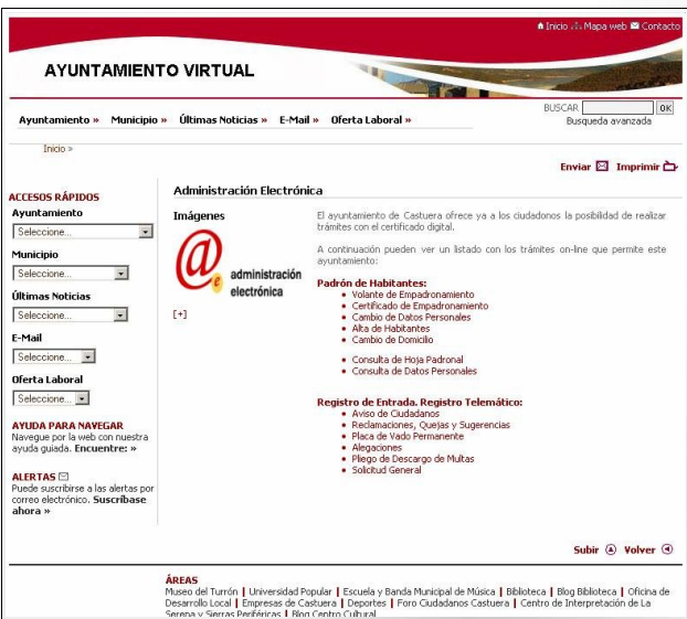
Página web: Ayuntamiento Virtual