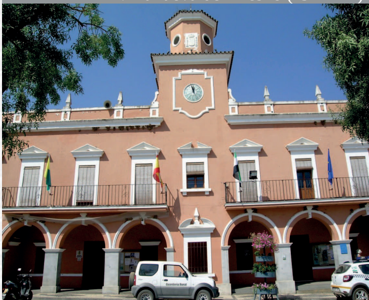
Ayuntamiento de Villanueva del Fresno

STREMADURA Por Lopez año de 1700. y pa Fuera, por el ucia, y por el Occidente con alien- incia del Reyno de Portugal. nte a sus 52. leguas, y Norte por lo mas ancho tertilidad esta Pro- Rios Tago, y Guadiana, viesan por enmedio, y chicas, que son el diomon- y el stradilla & Badajoz la, Capital de la Provin- Obispado, y un Puente sobre diano, edificado por los llaza de Guerra, y tiene Castillos, el uno del rejal, y del otro lado erro esta el fuerte de S. Merida, y en esta Angu- nto tiempo libre de la antigua situada sobre el Rio Guadiana.