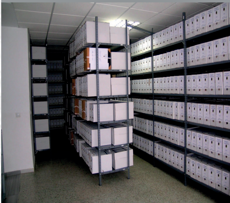
Archivo Municipal de Villanueva del Fresno después de la elaboración del inventario.