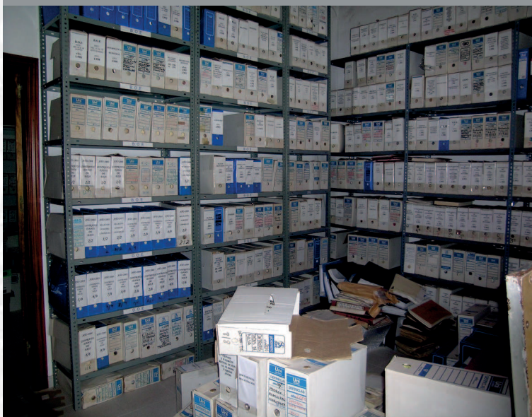
Archivo Municipal de Villanueva del Fresno antes de la elaboración del Inventario.