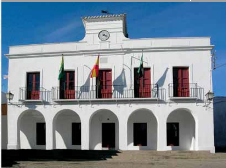
Fachada del Ayuntamiento.